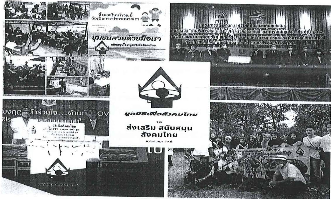
กิจกรรมเพื่อสังคมและประเทศชาติ(บางส่วน) โดยมูลนิธิเพื่อสังคมไทยและสมาชิกเครือข่ายรางวัลไทย